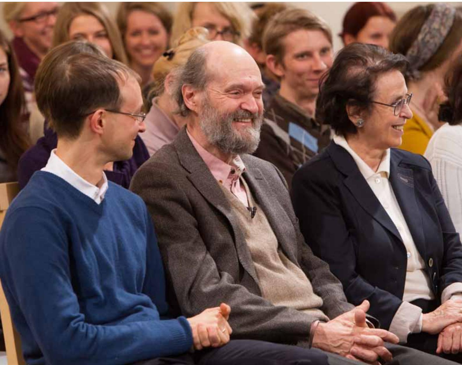
Pärdid loengut kuulamas. TÜ aula, 20. november 2013