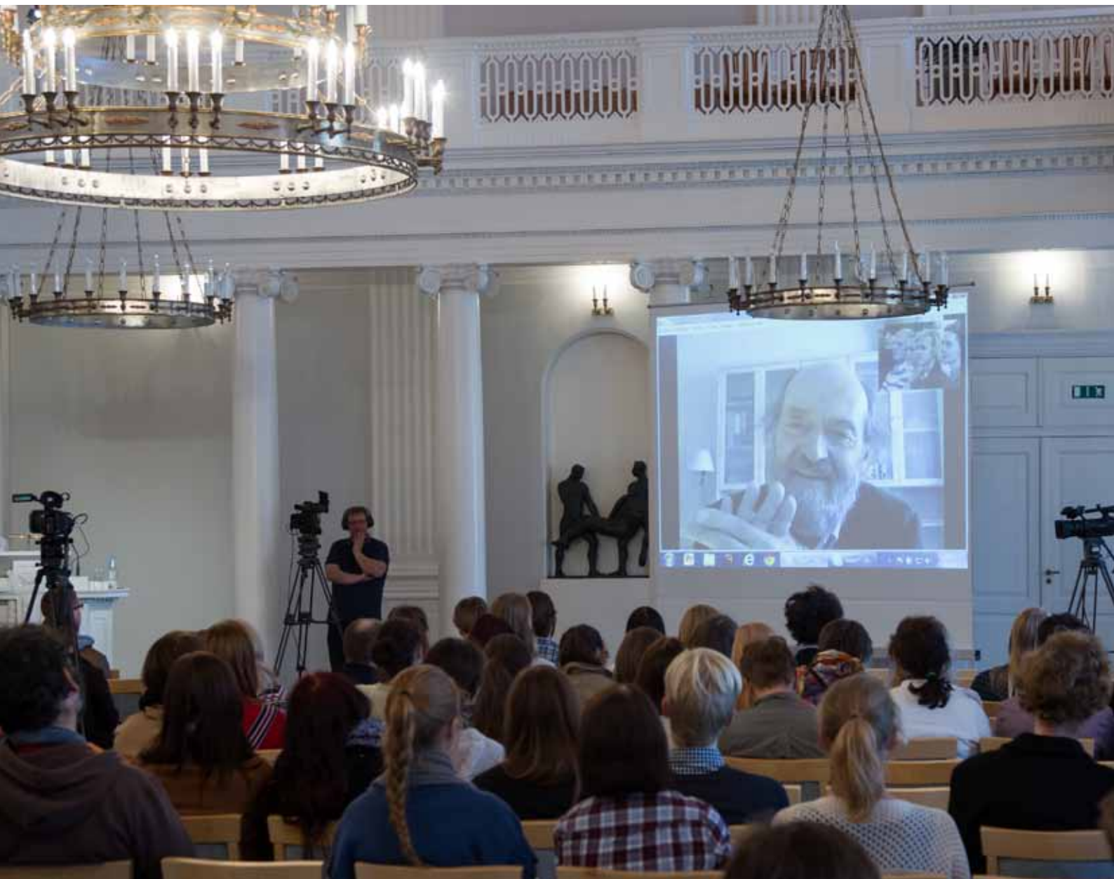
Helilooja Arvo Pärt pöördub kuulajate poole videosilla vahendusel. TÜ aula, 25. september 2013