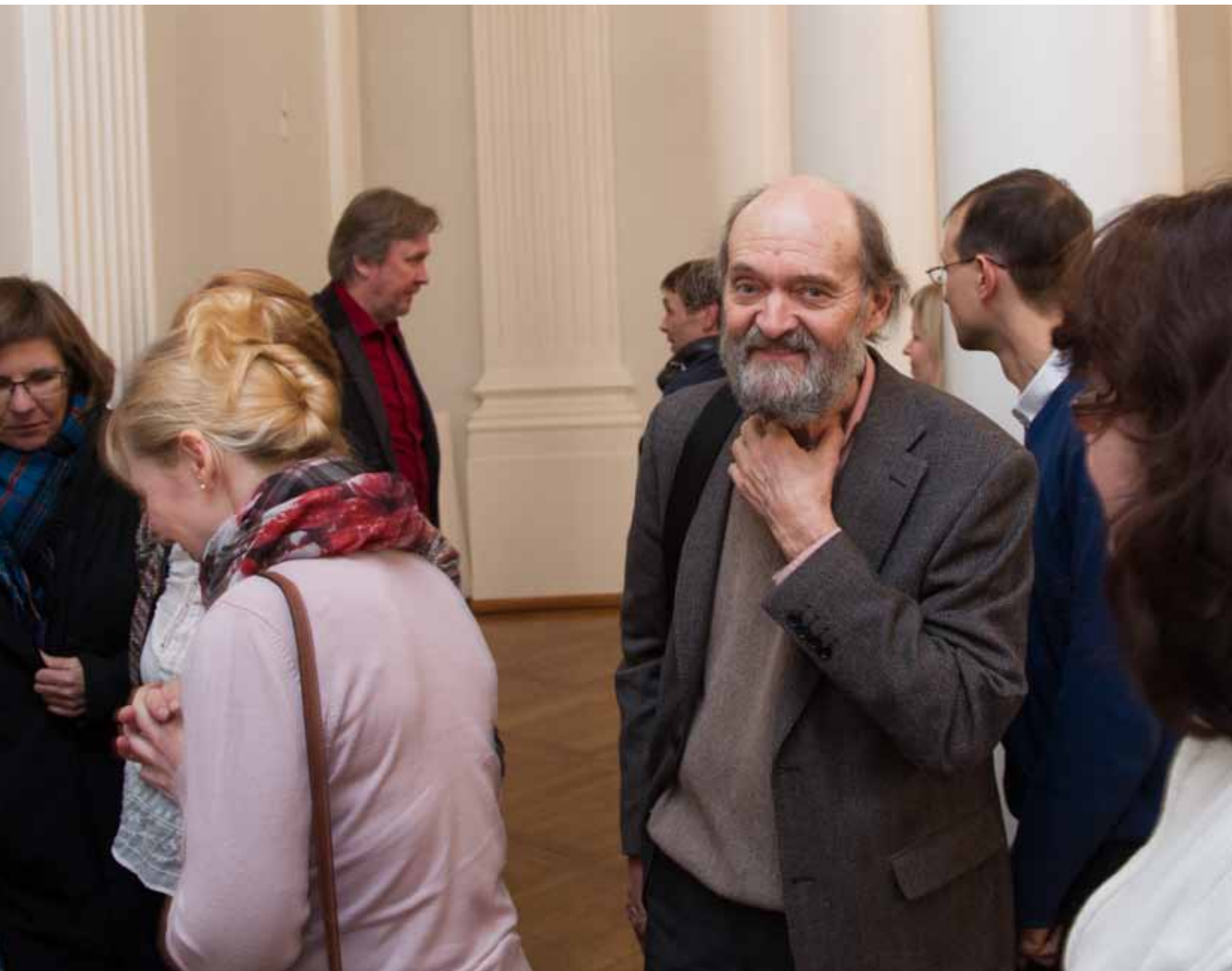
Loeng on lõppenud. TÜ aula, 20. november 2013