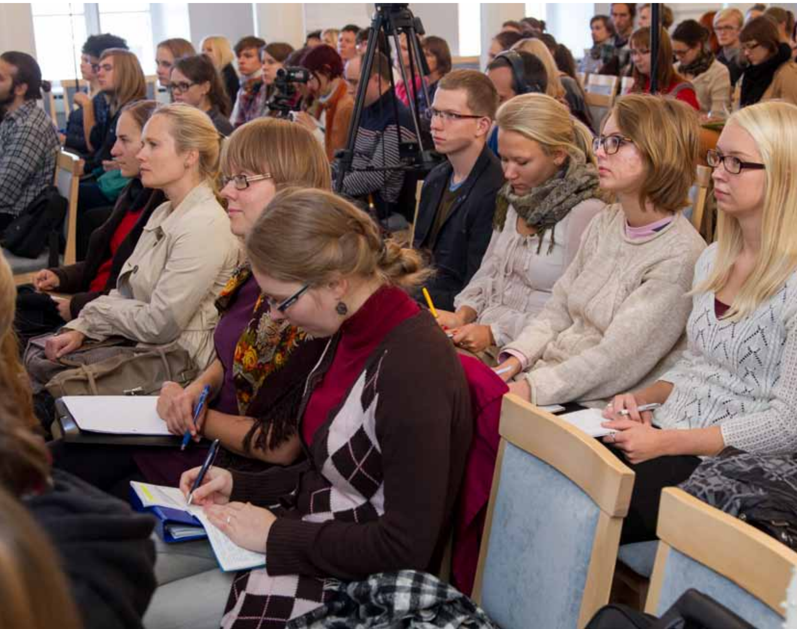
„Sõna ja muusika” seminar. Vaade saali. TÜ aula, 25. september 2013