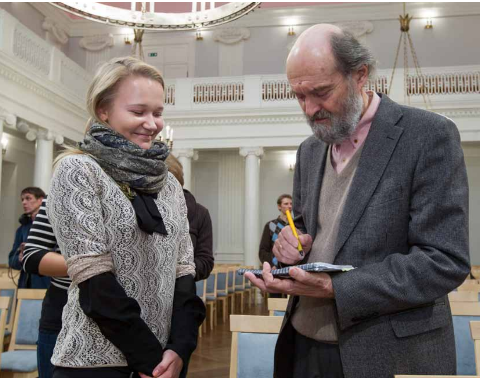
Autogramm üliõpilasele. TÜ aula, 20. november 2013