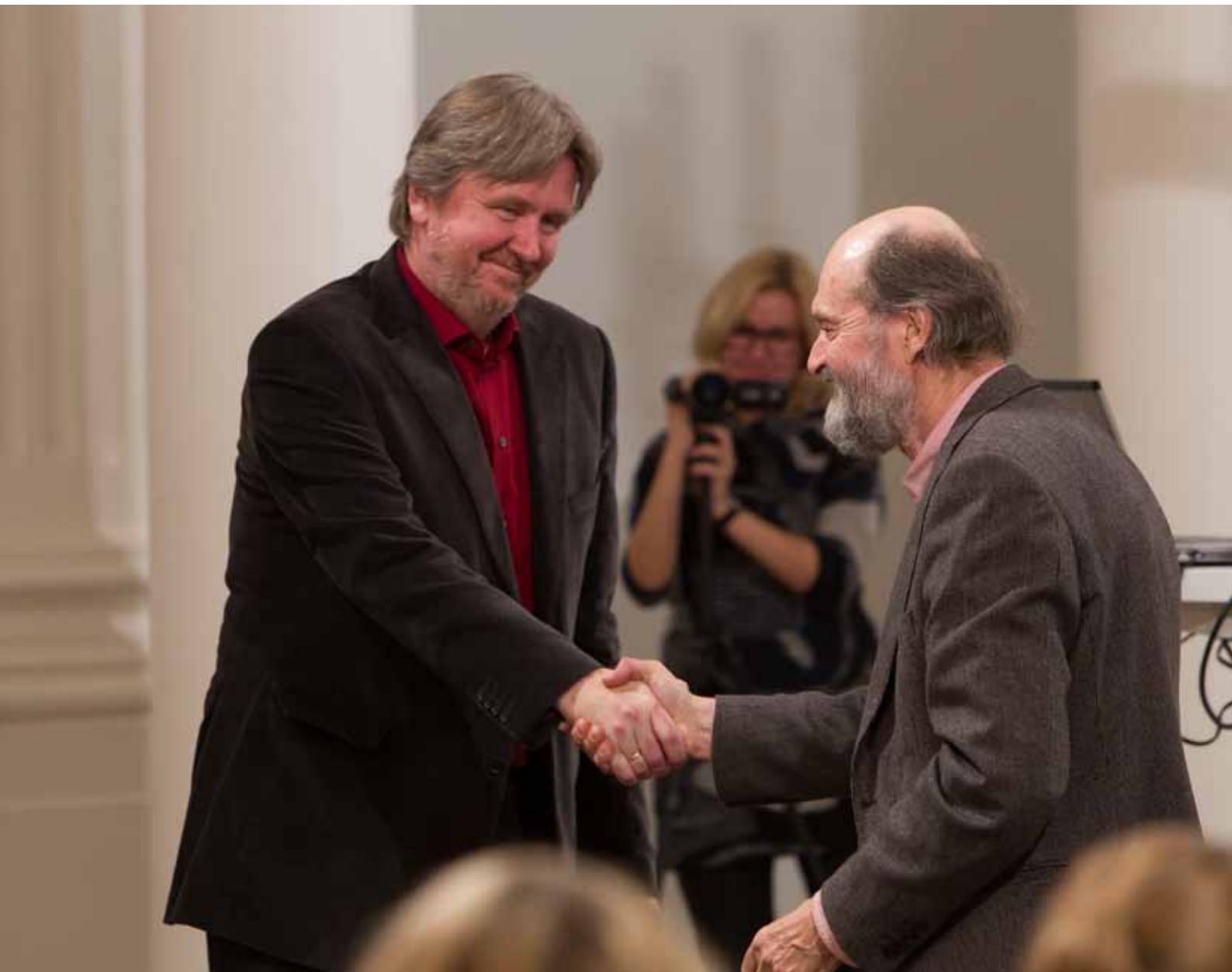
Toomas Siitan ja Arvo Pärt kätlemas. TÜ aula, 20. november 2013