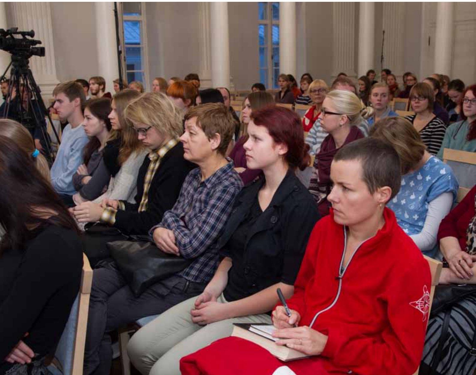
„Sõna ja muusika” seminar. Vaade saali. TÜ aula, 20. november 2013