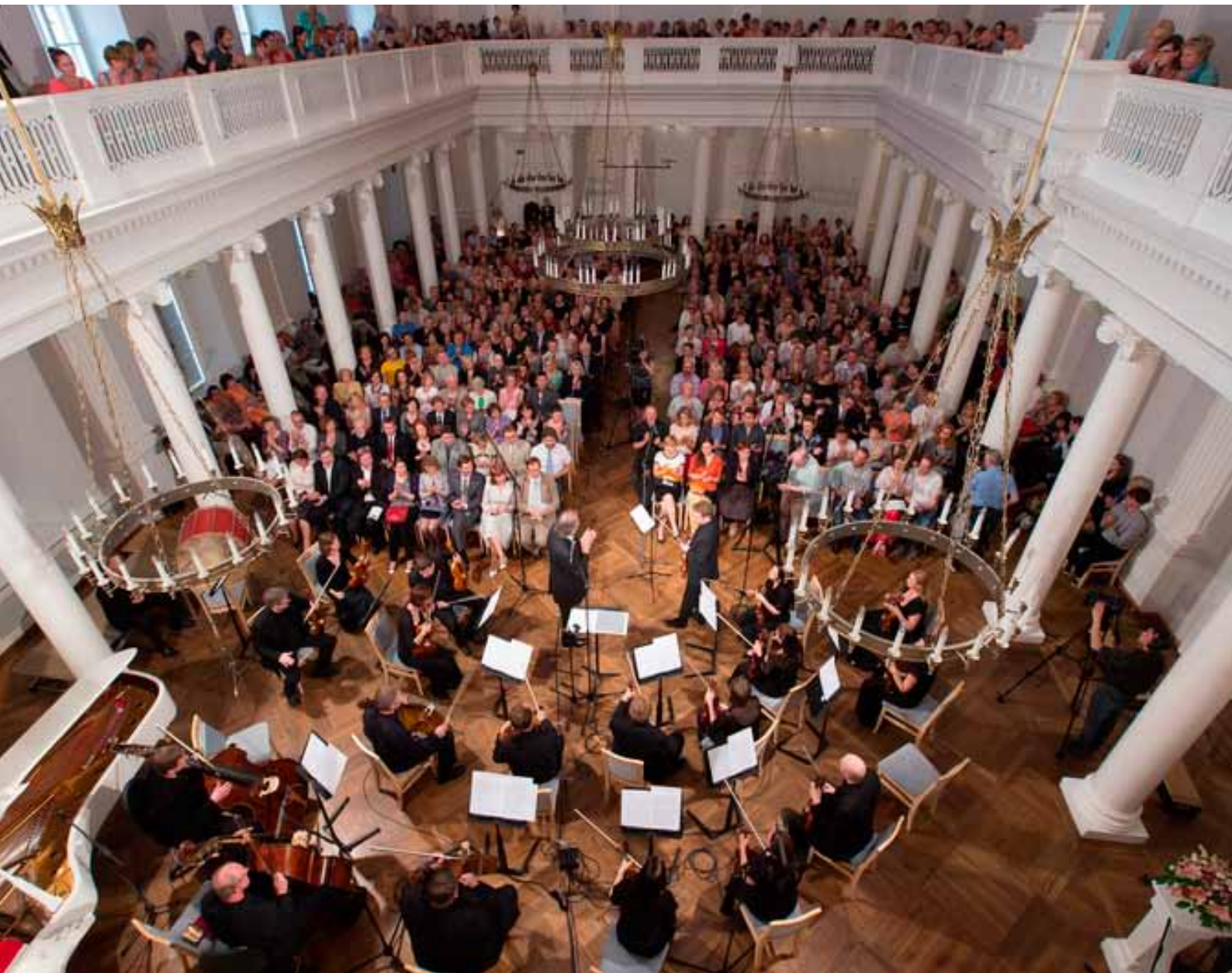
Arvo Pärdi loomingu kontsert Tartu Ülikooli aulas. Vaade aulale. 21. mai 2014