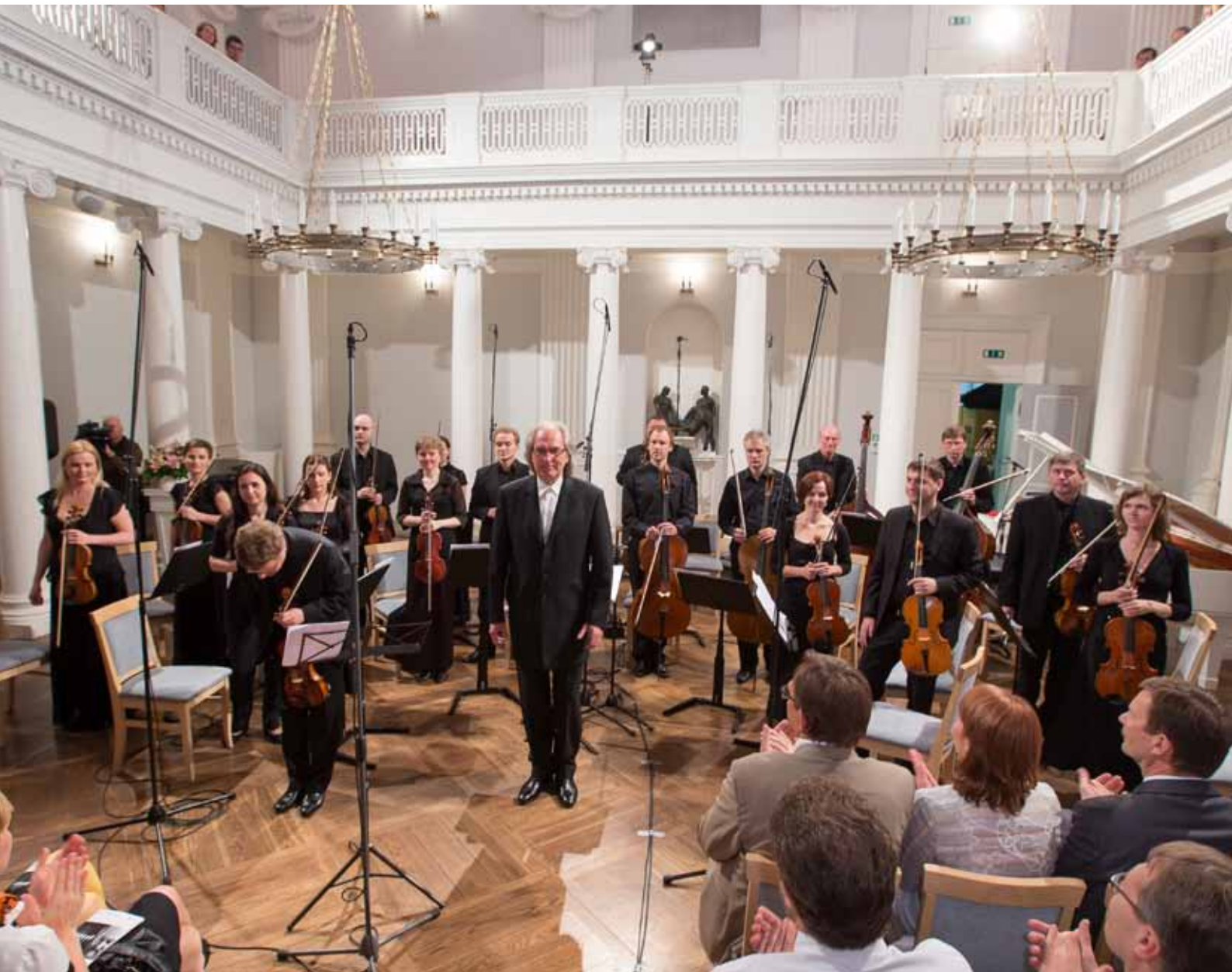
Dirigent Tõnu Kaljuste TÜ aulas kontserdil. 21. mai 2014