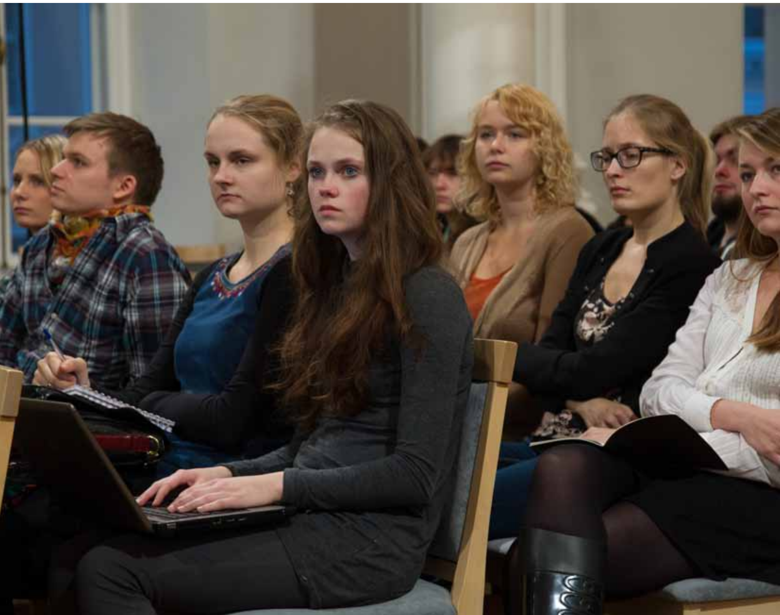
„Sõna ja muusika” seminar. Vaade saali. TÜ aula, 20. november 2013