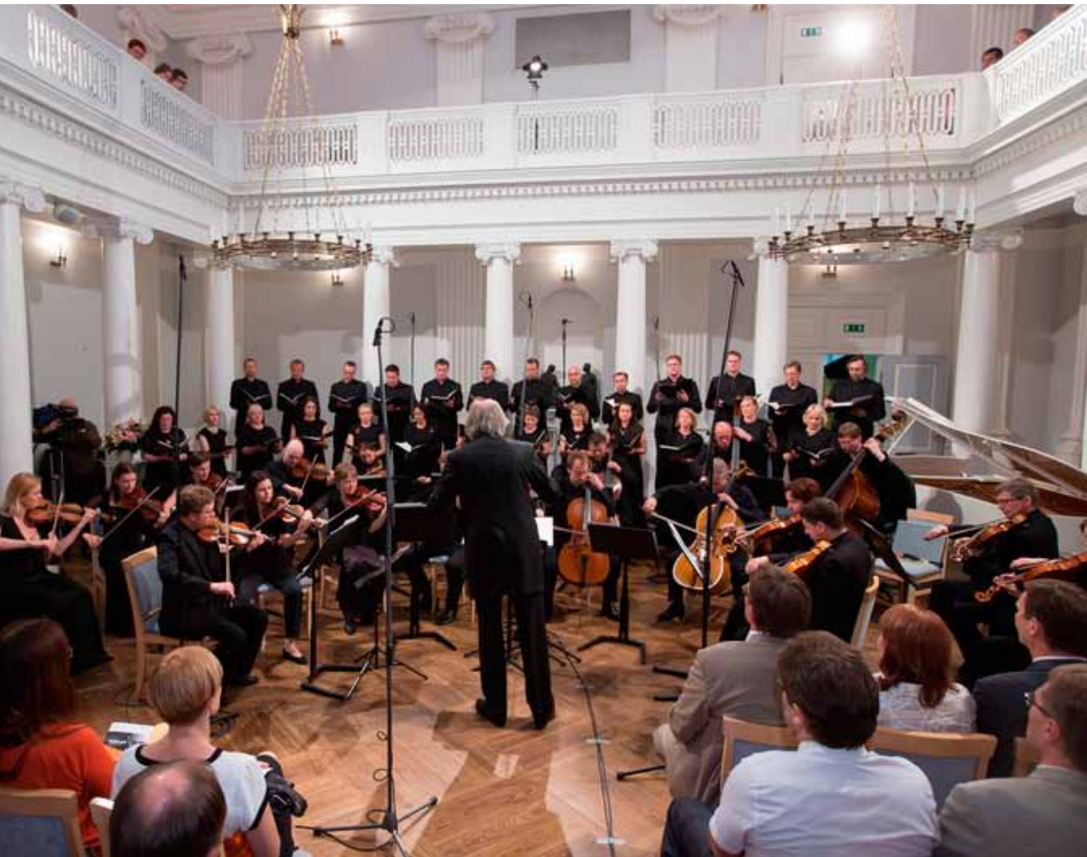
Arvo Pärti loomingu kontsert Tartu Ülikooli aulas. Esinevad Eesti Filharmoonia Kammerkoor ja Tallinna Kammerorkester dirigent Tõnu Kaljuste juhatusel. 21. mai 2014