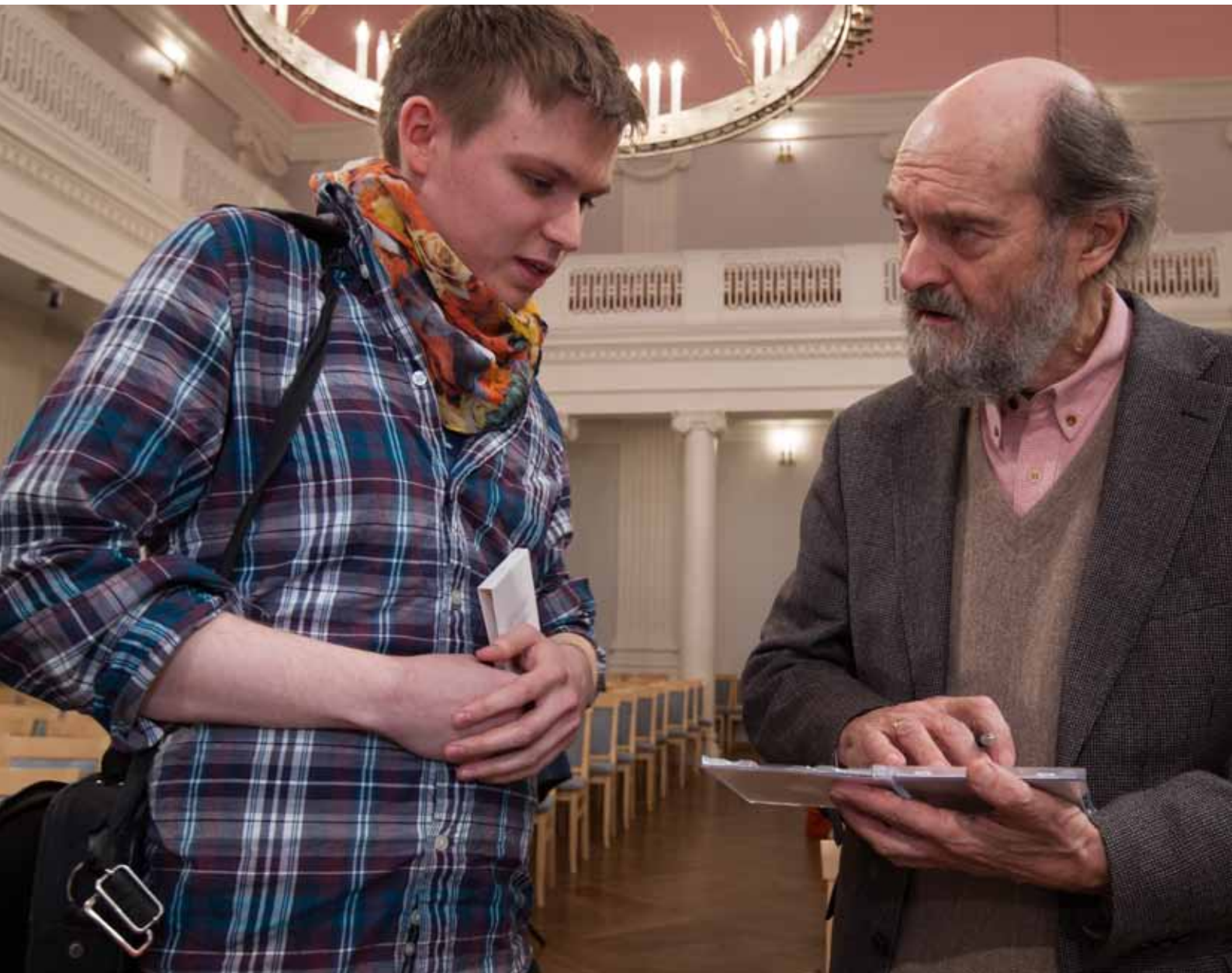
Autogramm üliõpilasele. TÜ aula, 20. november 2013