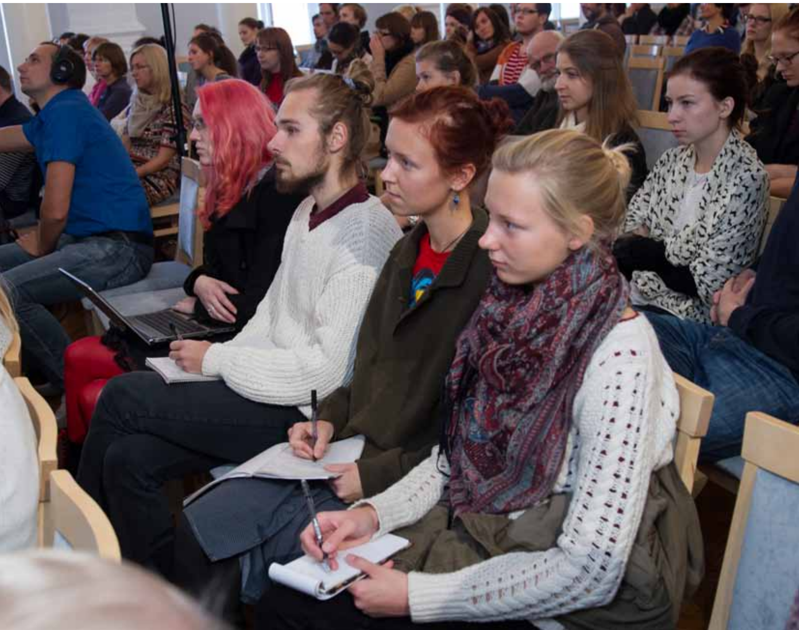
„Sõna ja muusika” seminar. Vaade saali. TÜ aula, 25. september 2013